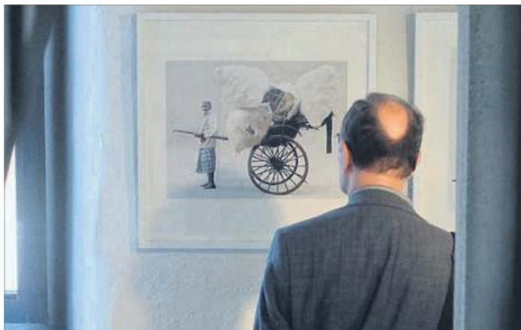
Einen Lastenträger in Kalkutta zeigt dieses Foto von Anja Bohnhof. (Foto: Denzer)

Die Fotografie des Mannes, die Teil der Ausstellung „Mensch und Arbeit“ im Zündorfer Wehrturm, Hauptstraße 181, ist, ist eben in dieser Megametropole Kalkutta entstanden. Dabei werden die „Bahak“ – drei weitere Bilder dieser Serie von Anja Bohnhof sind Teil der Ausstellung – isoliert vor einem hellen Hintergrund ge-