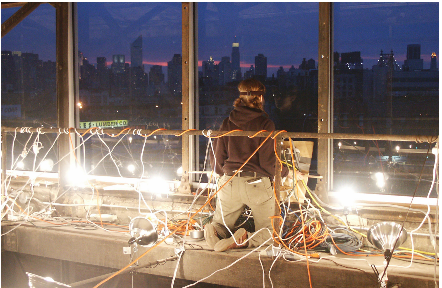
Abbildung: Klara Hobza, Morse Code Communication, 2005, Foto: Tim Hyde