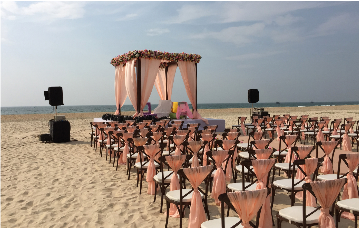
Abbildung: Anja Bohnhof, love comes later, Fotografie, 2022