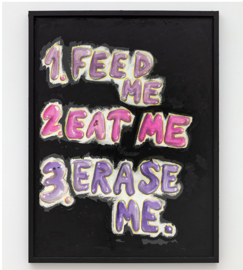
Abbildung: Jody Korbach, Feed Me, Eat Me, Erase Me, Tusche, Aquarell, Industriemarker auf Bilderrahmen, 2022