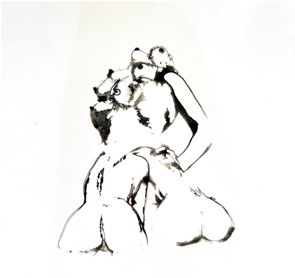
Abbildung: Yvonne Diefenbach, La Tour, Chemigramm, 18x13cm, Unikat, 2017/2023